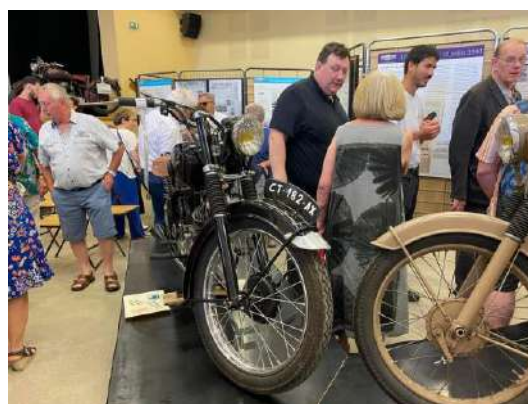
Les motos Gima

Panneaux d'exposition riches d'informations