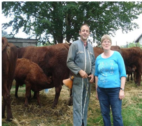
La race Salers à l'honneur

En dépit du temps incertain le 9 août fut une belle journée à Église-neuve d'Entraigues, une journée dédiée aux Richesses de nos Montagnes, pleine de bonne humeur, d'animations et de rencontres, une journée qui a apporté bien des joies aux habitants comme aux nombreux visiteurs. Entre délices du palais, admiration pour l'art du fauconnier et pour la prestation de la Troupe de l'Escourdou qui régala un public dense avec le troisième épisode des « Boudins », farce paysanne modernisée, il y en eut pour tous les goûts. Les enfants se sont pressés nombreux autour de la Fée Malou pour que celle-ci décore leurs frimousses de décors multicolores et, le soir, un feu d'artifice fut tiré au foirail pour qu'un magnifique bouquet serve de point final à cette belle journée.