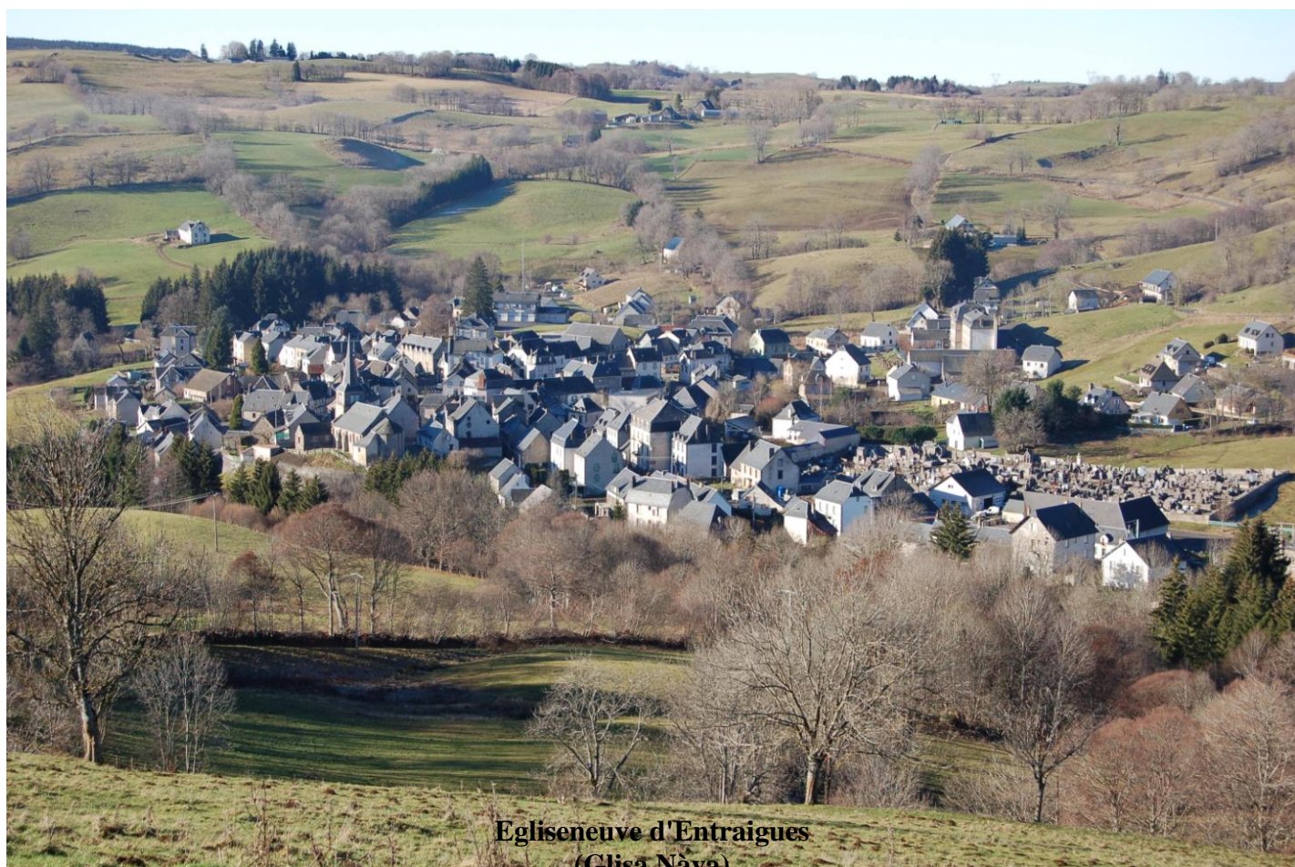
Eglise-neuve d'Entraigues (Glisa Nàva)