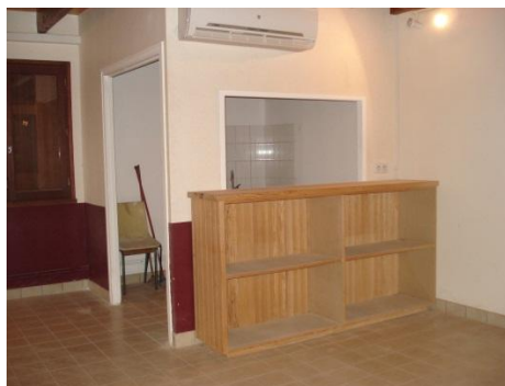
← La cuisine